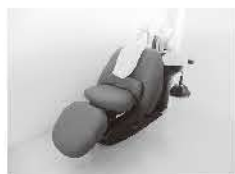
▲半個室のシャンプー台。髪質や頭皮の悩みにも対応いたします。

市十ヶ所にオープンした美容院 cerisier スリジェ。「お客様一人ひとりにあったヘアスタイル」をコンセプトに、髪質や頭皮の悩み、エイジングケアなど、ご要望に合わせた施術を提供します。白を基調とした解放感ある店内には半個室の席が2席。キッズスペースも併設し、お子様連れのお客様も安心してお過ごしいただけます。おすすめメニューはヘッドスパ。頭皮のクレンジングやマッサージ等のケアをフルフラットのシャンプー台で体感いただけます。スリジェで癒しのひと時を過ごしてみませんか？