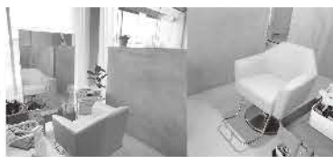
▲席は仕切りのある半個室。ほかのお客様の目を気にせずゆったりお過ごしいただけます。