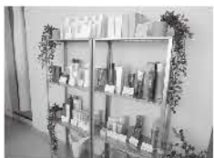
▲最新のカラーリング専用製品の販売も承ります。