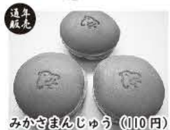
みかさんじゅう (110円)

「御菓子司 福本堂」は洲本市下加茂にある和菓子店です。素材と昔ながらの製法にこだわり、丁寧に手作りしているお菓子は、その繊細な風味が魅力。みかさんじゅうやいびつもちといった定番商品から、いちご大福のような季節ものまで、様々なお菓子を取り揃えています。「できたて」をおいしく召し上がっていただきたいとの思いから、ご予約に合わせて少しずつ製造しているため、ご来店の際はお電話での事前の確認・ご予約がオススメ。少数からのご注文はもちろん、祝事や仏事用の詰め合わせなども、ご予算・ご要望に合わせて承ります。ぜひ、お気軽にお問合せください！