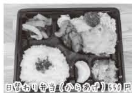
日替わり弁当(お肉あり) 550円

うっどぺっかあは掃守にできたお弁当屋さんです。メインディッシュからドレッシングに至るまで、手作りと地産地消にこだわったお弁当を販売しています。手作りを安く食べていただきたいとの思いから、ほとんどのお弁当が500円前後とリーズナブルで、かつボリューム満点なのも嬉しいポイント。メニューは日替わり弁当とサンドイッチの主に2種ですが、事前にお電話をいただければその日仕入れた食材によるオーダー弁当もご用意!是非、ご利用ください!