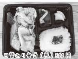
日替わり弁当(魚) 500円