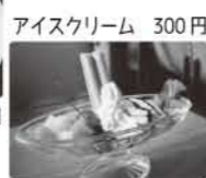
アイスクリーム 300 円