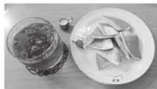
ケーキセット 600 円