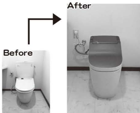
▲ トップカバーは紅殻(ベンガラ)色。濃い赤みが特徴の、パッと目を引く鮮やかな色合いです。