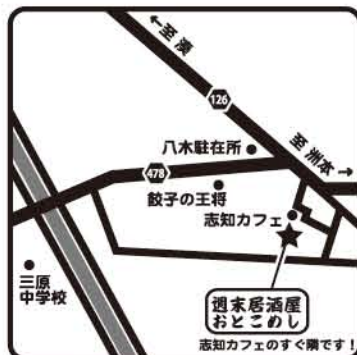
週末居酒屋 おとこめし 志知カフェのすぐ隣です!

▲一番人気のしろなべ! だしには自家製鶏ガラベースに甘みが特徴の博多しょうゆ、上品な甘みが特徴のあごだし、青森産のブランドニンニク「福地6片ホワイト」を使用。これら4つを独自配合で作ったあげた自慢の白だしです!