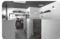
▲店内はとってもオシャレです!