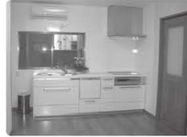
▲ 部屋を広く使える様、キッチン は壁面です。