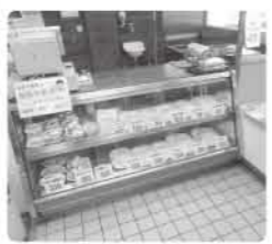
今夜の晩御飯にもう一品いかがですか？

業務用の卸や配達も承っております。見積もりなどもできますので、お気軽にお問い合わせください。