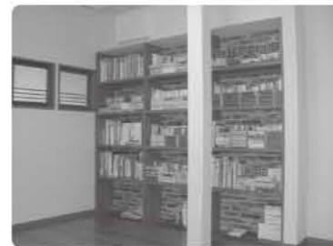
安心して本を並べられる 耐荷重棚(40/kg枚)

住み慣れた家の間取りは変更せずに水廻りを中心にバリアフリー工事をしました。段差がなくなり 老後も安心・快適に暮らせる場所になりました。