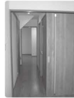
◀ 建具を改修してバリア フリーにしました。