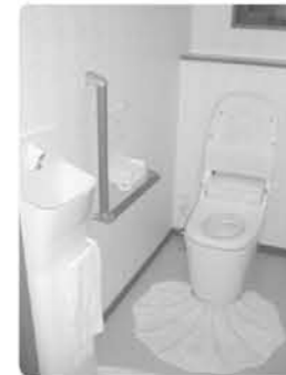
◀ 介助できるスペースを 確保したトイレ。